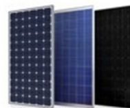
Photo-voltaïsche zonnepanelen - ook wel PV panelen genoemd - zetten zonlicht om in elektriciteit. Een omvormer maakt er wisselstroom van en voorziet elektrische apparaten in huis die ontstaan van stroom. De zonnestroom die over is gaat via de meter het openbare net in. Via uw energieleverancier wordt dit - tot en met 2026 in ieder geval - 'gesaldeerd' met de stroom die u op andere momenten uit het net haalt.

Ook na het afschaffen van de salderingsregeling blijft het interessant om zonnepanelen aan te schaffen, vooral omdat ze in de afgelopen jaren zo snel in prijs zijn gedaald. Met een volledig elektrisch huis kunt u met zonnepanelen een significant deel van de opgewekte energie zelf direct gebruiken (gemiddeld ongeveer 25%). Bij de aanschaf van een accu kunt u dit percentage zelfs naar 50% brengen. Uw vaste lasten gaan hiermee dus maandelijks omlaag.