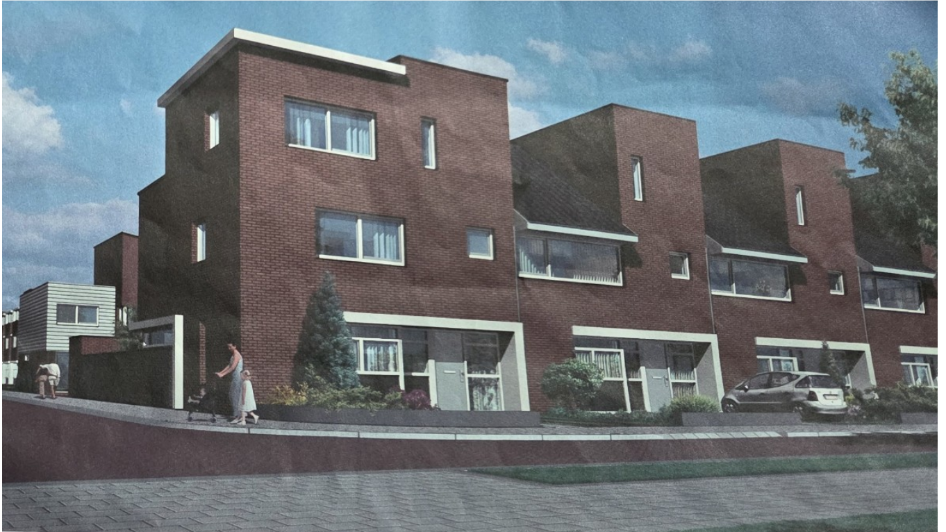
Woningtype 7 eiland 1 Floriande Hoofddorp